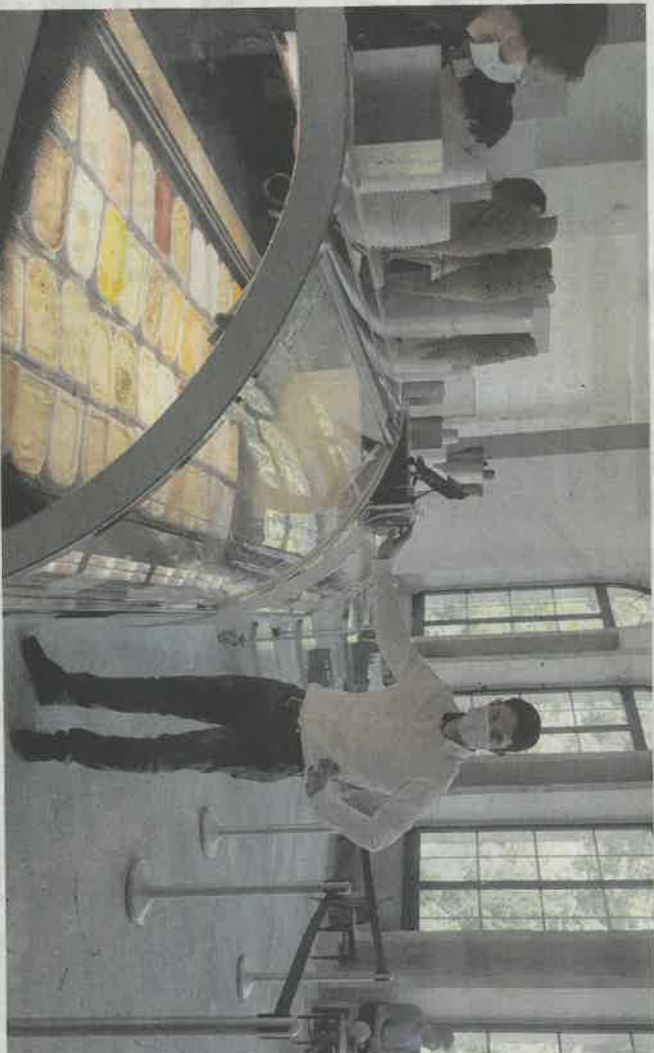
Terre adélice a ouvert l'été dernier un salon glacier sur son site historique du Moulinon, à Saint-Sauveur-de-Montagut.